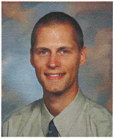
Christian Becker Medical Col of WI