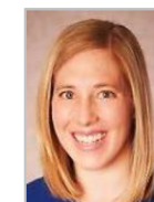
Sarah Welsh Medical College of WI