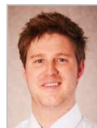
Scott Carver Medical College of WI